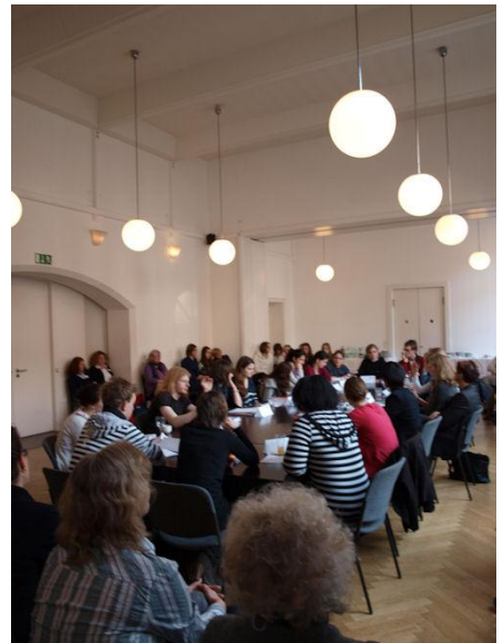
Die niedersächsische Jury bei der Debatte